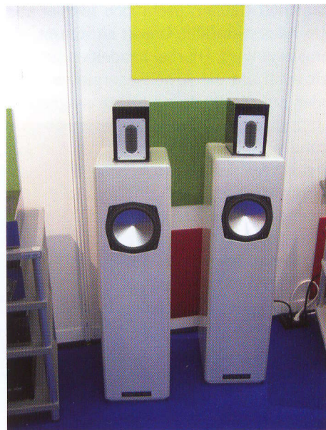
Lautsprecherbau ist ein Hobby von Rolf Gemein. Nur wenige Paare entstehen exklusiv pro Jahr: Hier die RG 5 Edition mit Air Motion Transformer