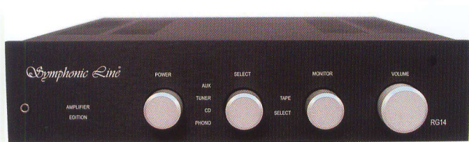
Der junge Bruder des RG 9: Vollverstärker RG 14 Edition mit 2 x 100 Watt Sinus an 8 Ohm

Version RG 8 Gold wird ausschließlich mit speziellen „Zutaten“ für Symphonic Line gefertigt.