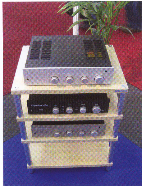
Vollverstärkerparade: RG 9, La Musica, RG 14 (v.o.)